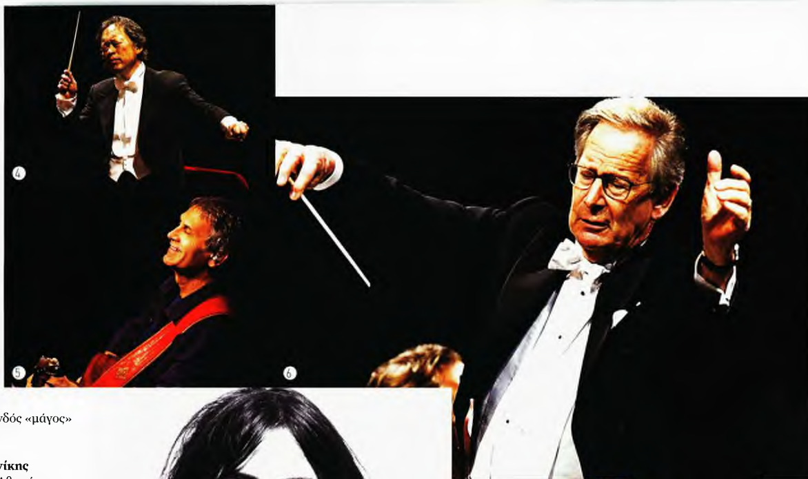
1. Ηρώδειο. 2. Μαξ Ρίχτερ. 3. Γιαν Γκαρμπάρεκ. 4. Μιουνγκ Χουν Τσουνγκ. 5. Γιώργος Νταλάρας. 6. Σερ Τζον Έλιοτ Γκάρντινερ. 7. Πάτι Σμιθ. 8. Diana Krall

μπασιίστας Γιούρι Ντάνιελ και ο Ινδός «μάγος» των κρουστών Τρίλοκ Γκούρτου.